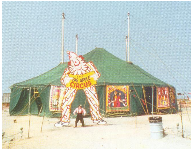
Le chapiteau du premier Big Apple Circus à New York (1977)

Avec le soutien de la Communauté Urbaine de Strasbourg, du Conseil Général, de la DDTEFP, de la DRAC - Ministère de la Culture et de la Communication, de l'ACSE, de la Région Alsace et de la Ville de Strasbourg.