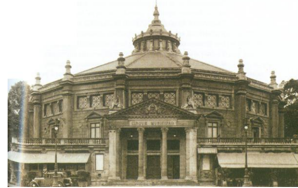
Façade du cirque d'Amiens (1910)

Pendant cette période faste, des cirques stables sont édifiés. Au même titre que la gare ou le musée, le cirque s'affirme institutionnellement et devient, dans la plupart des cas, municipal plutôt que patronymique. Elément d'architecture civile, le cirque stable rythme à son tour l'organisation de la place publique.